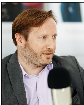
Gelesen von Georg Spirek (Hg.)